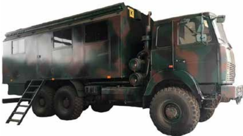
Рис. 1. Пересувна автомобільна ремонтна майстерня ПАРМ-2.01

3. Трифазна мережа з ізолюваною 380±10% В; глухо заземленою нейтраллю напругою