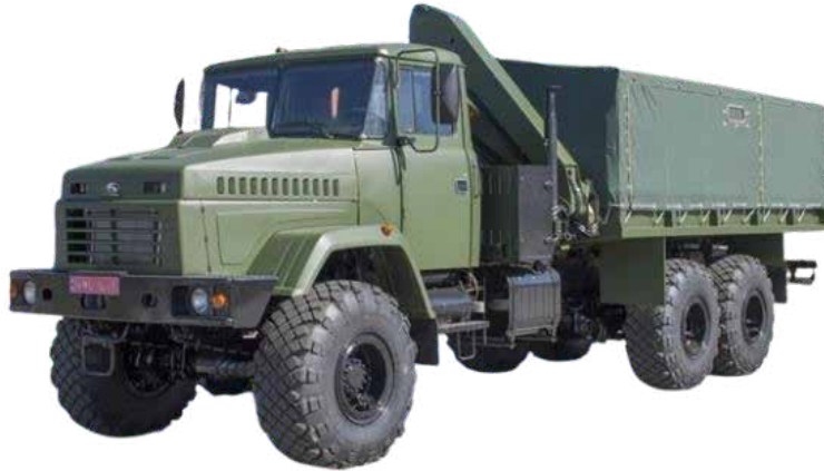
Рис. 3. Пересувна автотранспортна майстерня

Технічна характеристика пересувної автотранспортної майстерні (ПАРМ) з евакуаційним обладнанням КраЗ-6322 «Майстер»: