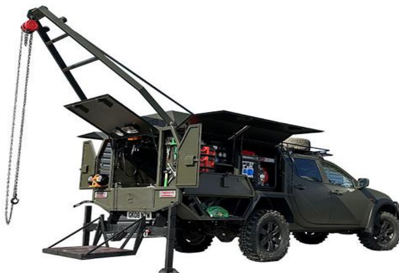
Рис. 2. Ремонтна автомобільна майстерня LOCKER

Автомобіль надійно працює в екстремальних природних, кліматичних і дорожніх умовах усіх континентів при температурі від -50°C до +60°C на висоті до 5 000 м над рівнем моря, долаючи водні перешкоди глибиною до 1,5 м і шар снігу до 0,6 м.